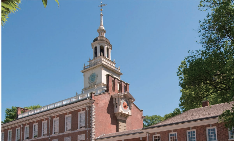
のちに独立記念館と呼ばれるようになった議事堂は、イギリス植民地時代の典型的な建築様式

トマス・ジェファソンが仕上げた独立宣言の草案は3日間討議され、全会一致で採択されたという。個人の尊厳や人間の平等・自由などを謳った内容は、アメリカはもちろん、人類史上もっとも重要な宣言となった。この歴史的な出来事を今に伝える貴重な資産として、独立記念館の普遍的な価値が評価され、1979年に世界文化遺産に登録された。