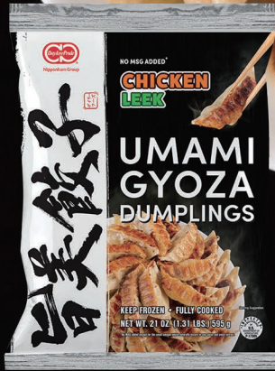
CHICKEN & LEEK