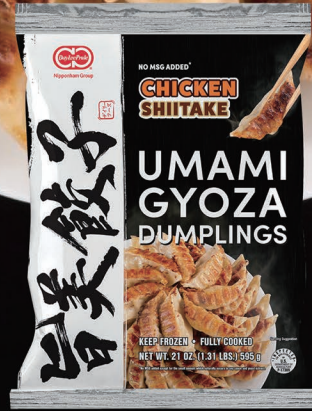
CHICKEN & SHIITAKE