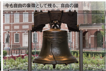
今も自由の象徴として残る、自由の鐘