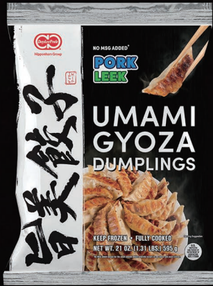
PORK & LEEK