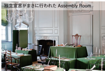
独立宣言がまさに行われた Assembly Room